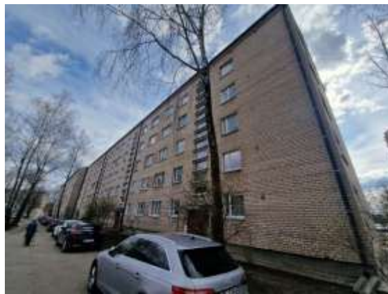
Dzīvojamā māja Inženieru ielā 7