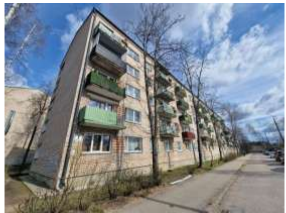
Dzīvojamā māja Inženieru ielā 7