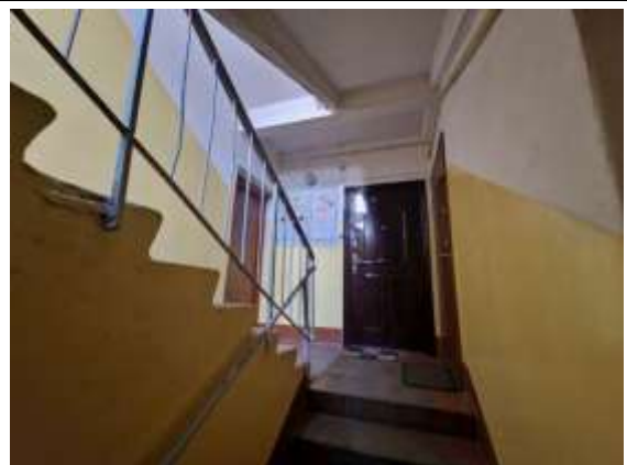
1.stāva kāpņu telpa