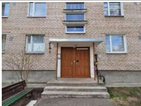
Ieeja kāpņu telpā