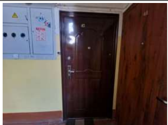
Dzīvokļa Nr.42 ieejas durvis