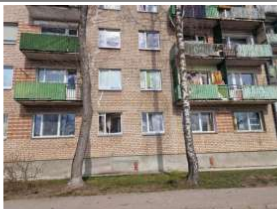
Dzīvokļa Nr.42 logi